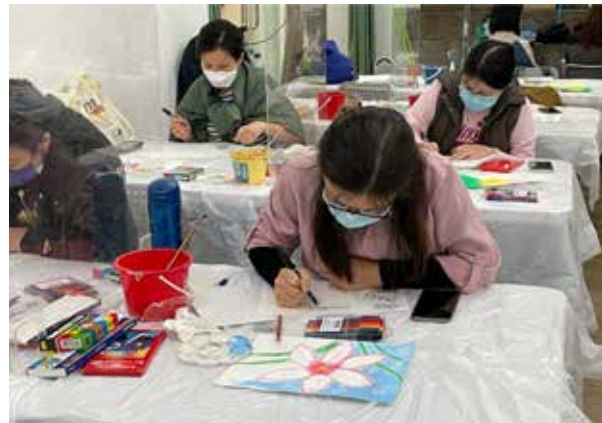
學員試驗粉彩特性