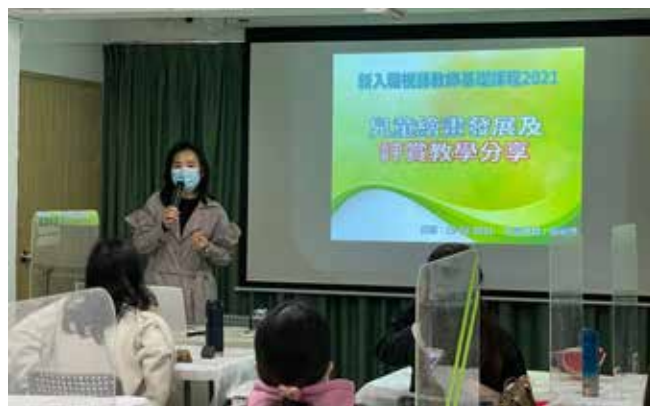
兒童繪畫發展及評賞教學分享