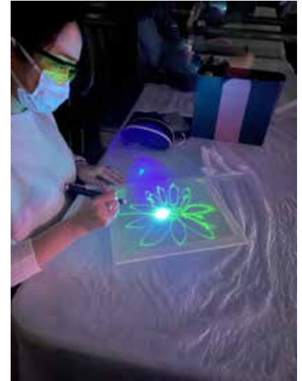
新媒體創作技巧及教學分享