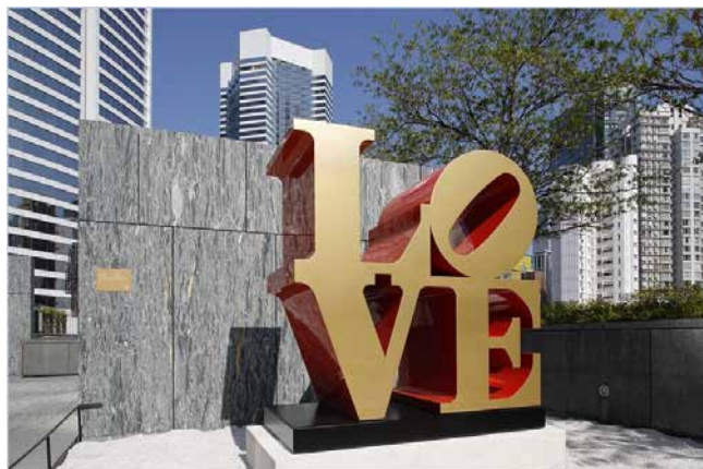
Robert Indiana, LOVE, 1966/2002, polychrome aluminum. H198.1 x W188 x D95.5 cm (including base). Edition of 6 + 2/4 APs. Private collection. Artwork © 2018 Morgan Art Foundation/Artists Rights Society (ARS), New York.