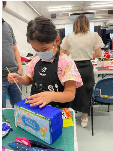
小朋友動手製作面紙盒