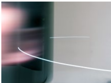
Mind Cut (局部) 董永康 動態錄像裝置 2018

一幀照片能夠把回憶定格，一部影片則讓人彷彿再次置身其中。香港藝術家董永康近年的錄像裝置創作，以「動態影像」為中心：他致力探索拍攝「影像」的方法，同時重新思考物理「動態」背後的意義——人類觀看或追逐動態的時候，怎樣體驗時間和空間的變化？CL3呈獻董永康個展《逐圓》，展出五組揉合了行為、錄像及機械動態的作品：螢幕畫面的無縫閃動，以及機械支架的精細律動，呈現一個接一個仿似永續不斷的循環，吸引觀眾隨藝術家設計的軌跡而行，從每個瞬間追逐永恆。