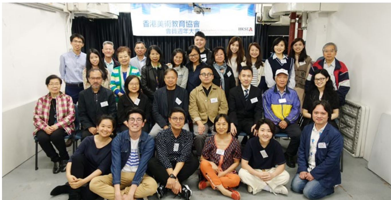
第27屆會員大會大合照