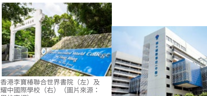
香港李寶椿聯合世界書院（左）及耀中國際學校（右）

國際學校與傳統學校在學制、設備、師資、文化及教學模式等方面上截然不同。為了讓本地主流學校的視藝教師了解國際學校的視覺藝術教育，本會將於4月27日（六）舉辦「師」人聚會：國際學校藝術穿梭遊。屆時將參觀耀中國際學校及香港李寶椿聯合世界書院兩所國際學校。參訪內容包括參觀耀中國際學校IB Art Exhibition 2019、校舍的視藝科設施、認識國際文憑大學預科（IBDP）與國際中學教育普通證書（IGCSE）視藝科課程，及國際學校的視藝教學分享，以向參加者提供與國際學校老師交流的平台。