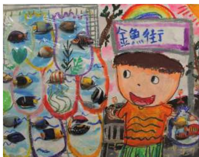
民生書院小學 盧學霖 金魚街