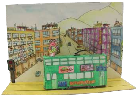
港大同學會小學 于澄 電車與香港