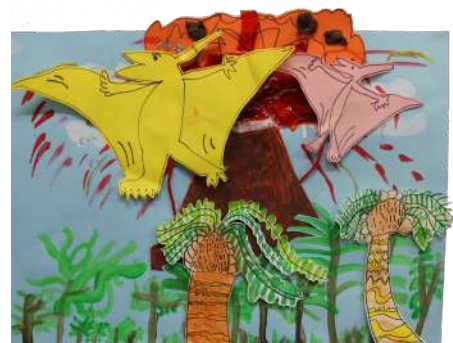
五邑工商總會張祝珊幼稚園 周細君 火山大爆發